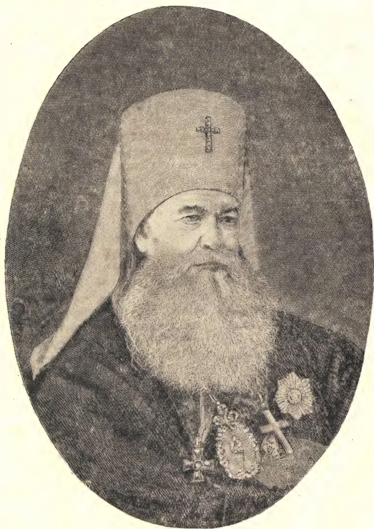
МИТРОПОЛИТ МАКАРИЙ (БУЛГАКОВ)